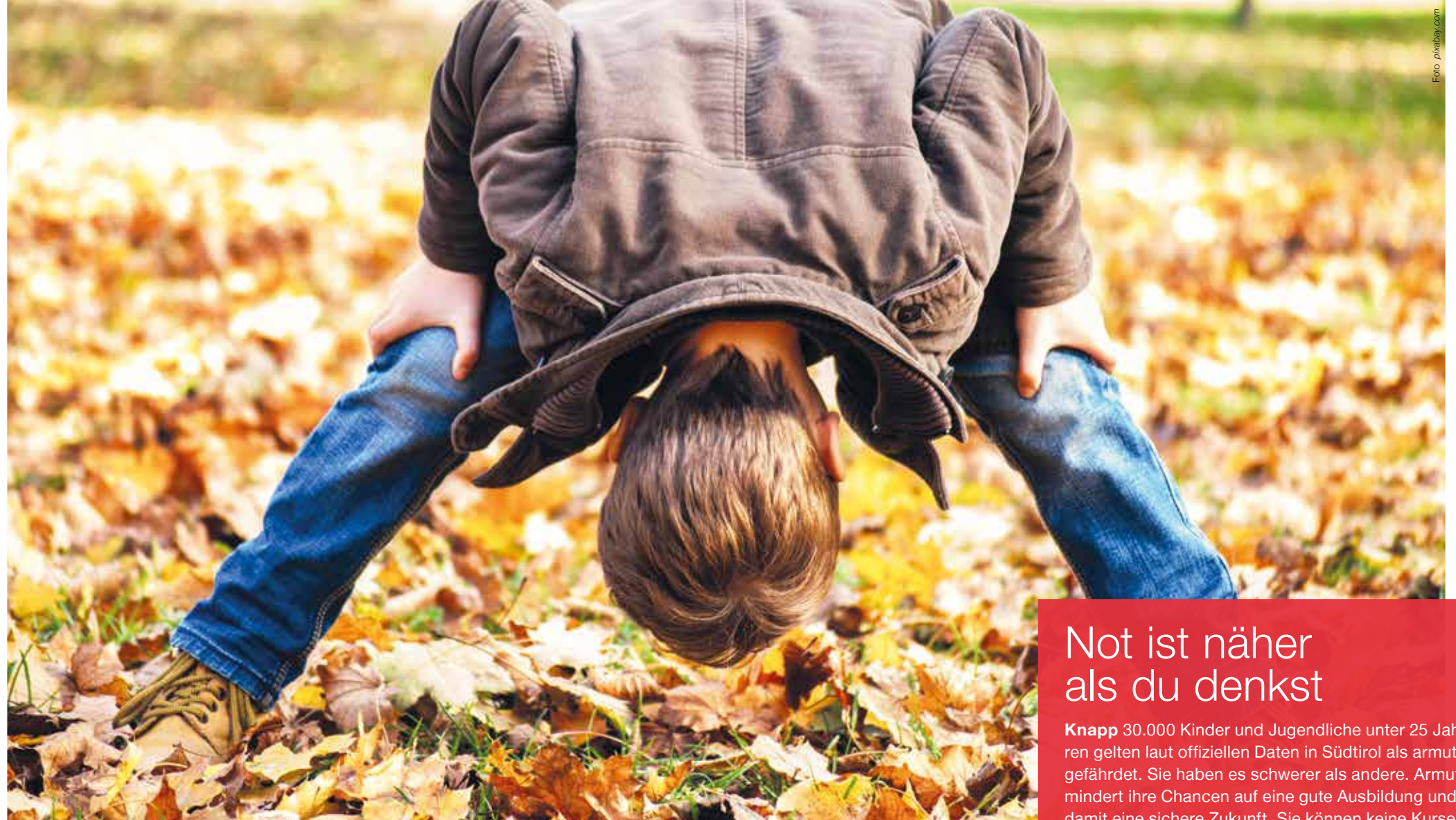
Kinder und Jugendliche aus armutsgefährdeten Familien haben es schwerer als andere. Die Caritas hilft diesen Familien, damit die jungen Menschen eine Chance bekommen.