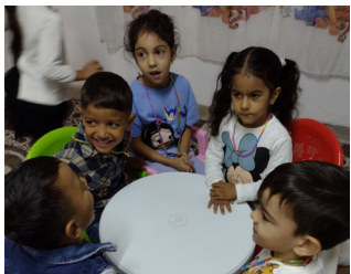
Macedonia del Nord

Meno di un caffè al giorno è quanto basta per dare un sostegno concreto a bambine e bambini in Kenya, Brasile, Bolivia o Macedonia del Nord. Con il tuo contributo, ti impegni insieme a noi a garantire, mensilmente o annualmente, alimentazione e istruzione ai minori che fanno parte del progetto da te scelto, in uno di questi quattro Paesi, contribuendo, al tempo stesso, a sviluppare le capacità strutturali e sociali della realtà che li circonda.