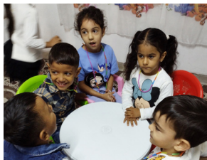
Macedonia del Nord

Meno di un caffè al giorno è quanto basta per dare un sostegno concreto a bambine e bambini in Kenya, Brasile, Bolivia o Macedonia del Nord. Con il tuo contributo, ti impegni insieme a noi a garantire, mensilmente o annualmente, alimentazione e istruzione ai minori che fanno parte del progetto da te scelto, in uno di questi quattro Paesi, contribuendo, al tempo stesso, a sviluppare le capacità strutturali e sociali della realtà che li circonda.